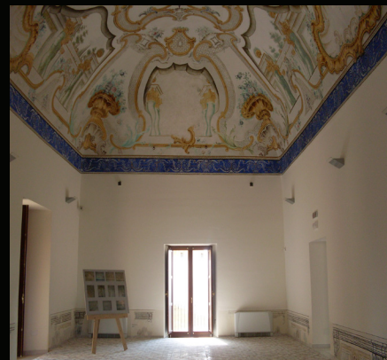
“Baglio Anselmi a Marsala (TP)”